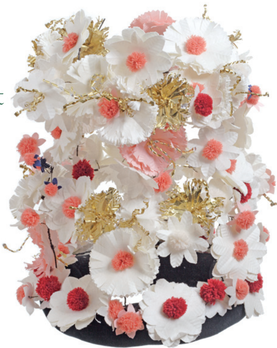
"Krans och Krona", heter Rackstadsmuseets stora sommarutställning i år.